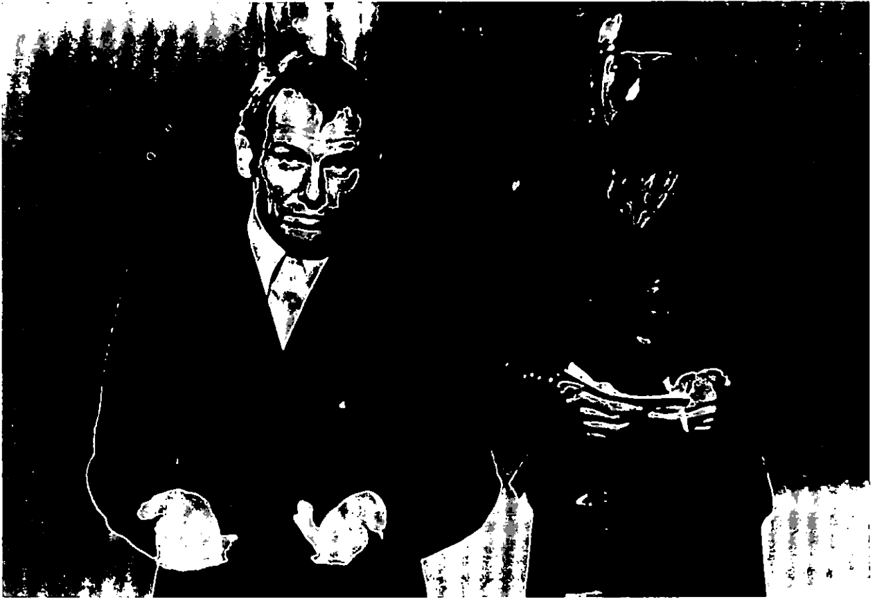
Klaus Lowitsch et Jean-Claude Dreyfus dans L'Ombre des anges (Daniel Schmid).